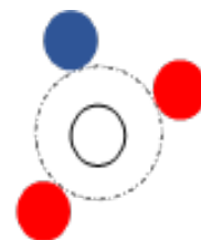
2-1で それぞれに加点